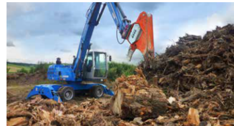
Se utiliza para limpiar el suelo.

Los datos técnicos y las ilustraciones no son vinculantes. Están sujetos a cambios por motivos de desarrollo posterior.