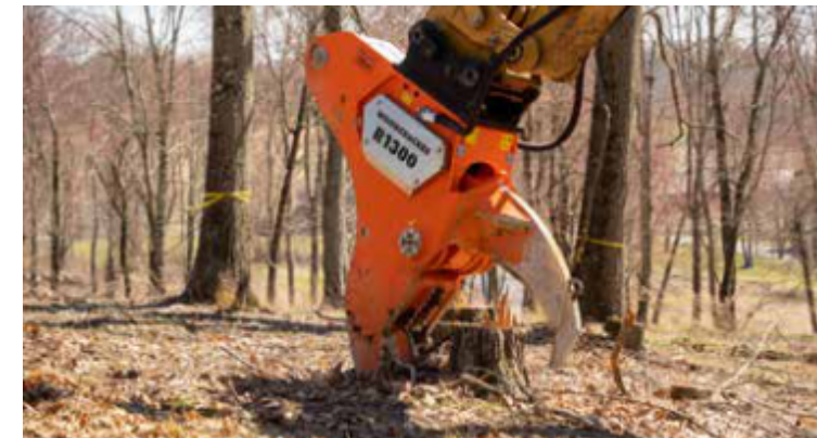
Unidad de corte robusta.