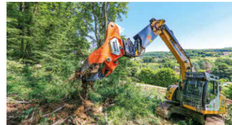
Retirar cuidadosamente todo el portainjerto del suelo.