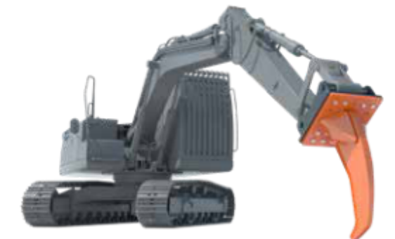
Woodcracker® Diente destripador