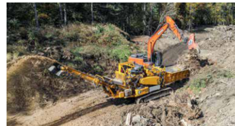
Trituración del material cosechado.