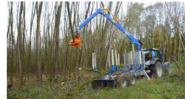
La grue CB150 est adaptée à une utilisation comme grue forestière.