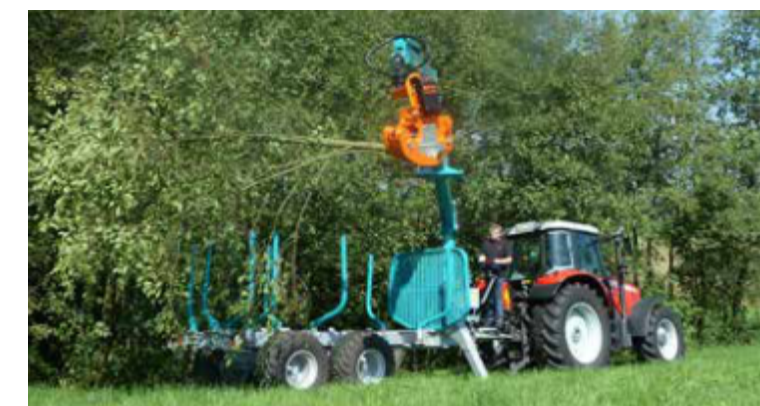
Récolte rapide des petits arbres et arbustes.