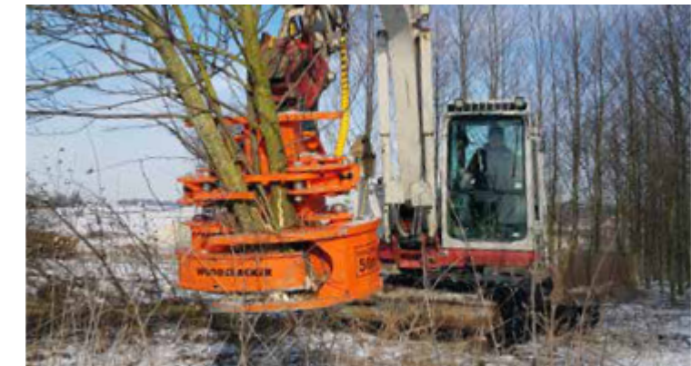
En option avec accumulateur.