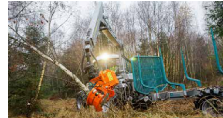
Idéal pour les matériaux fragiles.