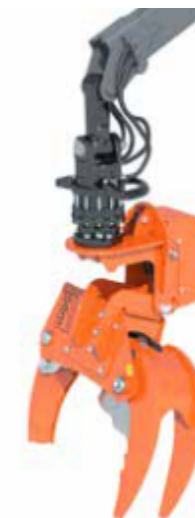
Fonction d'inclinaison automatique sur le Woodcracker® Grue CB150

Les données techniques et les illustrations ne sont pas contractuelles. Elles sont susceptibles d'être modifiées en fonction des développements ultérieurs.