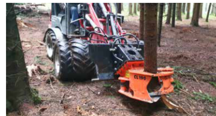
Woodcracker® La CL190 corta madera débil de hasta 25 cm.

Los datos técnicos y las ilustraciones no son vinculantes. Están sujetos a cambios por motivos de desarrollo posterior.