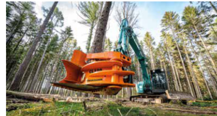
Cosecha rápida de árboles y arbustos pequeños.