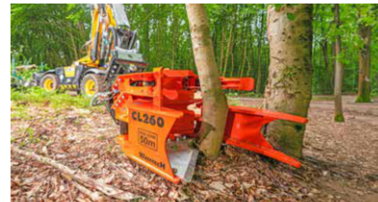
Disponible opcionalmente con acumulador.