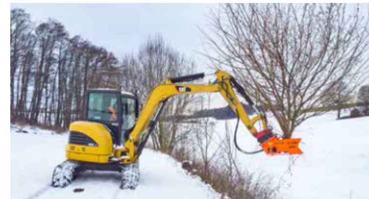
Para miniexcavadoras de 2,5 t.